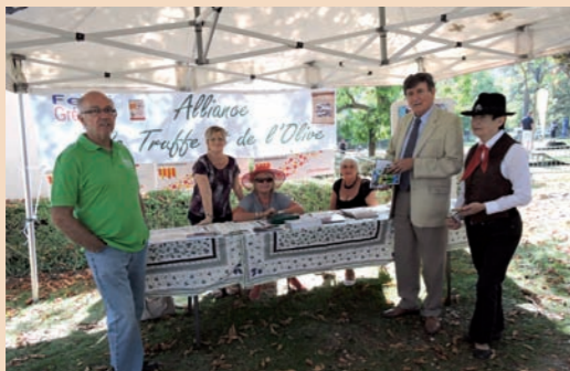
Festi Gréoux au Forum des Associations.

Le Forum des Associations a suscité, début septembre, son habituel engouement auprès de nombreux visiteurs. 26 stands dressés, en la circonstance, au parc Morelon en habit de fête. Dès le samedi après-midi, se sont succédé animations et démonstrations. Sur la piste BMX, de jeunes riders ont bondi sur les toboggans alors que, tour à tour, sur le podium, country dance et atelier musical (chant, piano, guitare) ont assuré le spectacle. Dans les stands, les « démos », ici et là, ont capté l'intérêt des visiteurs : tennis, rugby, team contact (kick-boxing), auto-massage Do in, technique japonaise traditionnelle par l'association Chandanan.