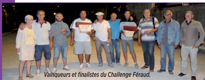
Vainqueurs et finalistes du Challenge Féraud.