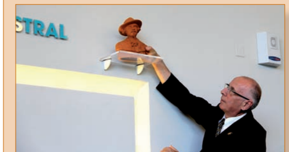
Le buste de Frédéric Mistral trône désormais au Centre de Congrès L'Étoile.