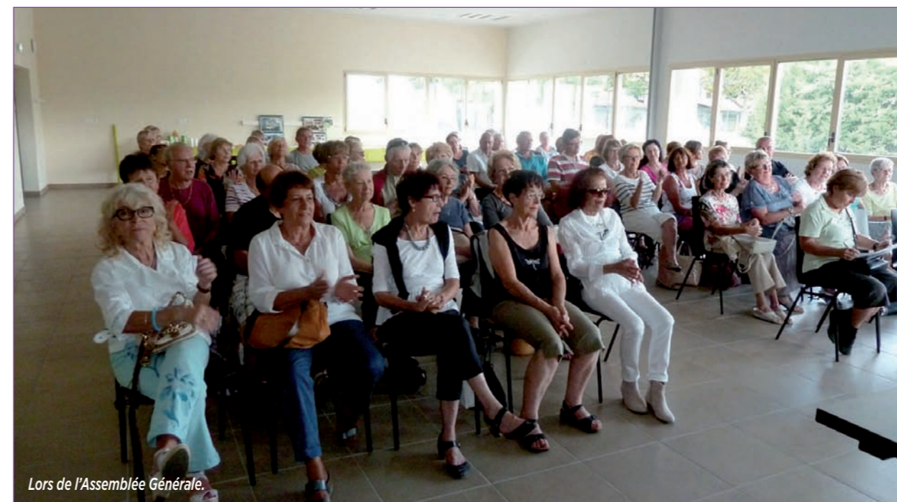
Lors de l'Assemblée Générale.