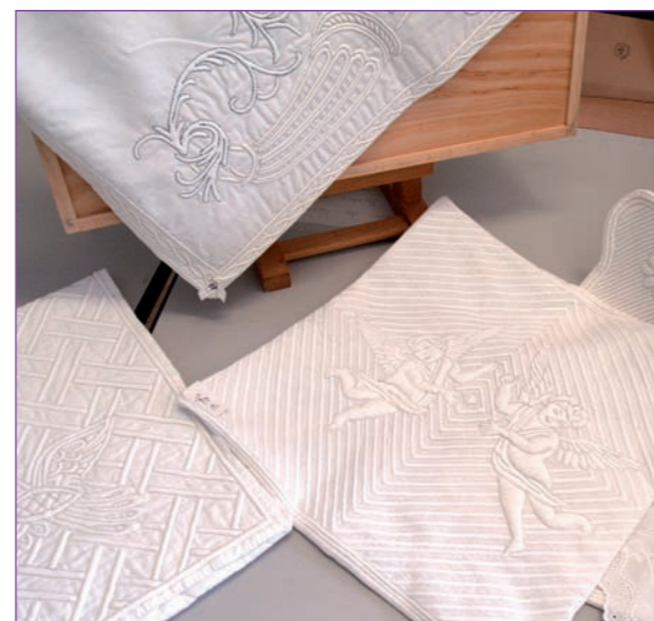
De la belle ouvrage !