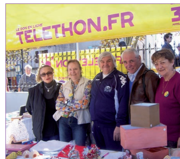
Le LAC, toujours présent au Téléthon