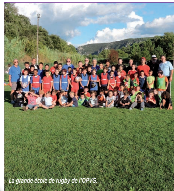
La grande école de rugby de l'OPVG.

Au sein de l'école de rugby en attente de labellisation F.F.R, la notion de mêlée est nouvellement introduite. ■