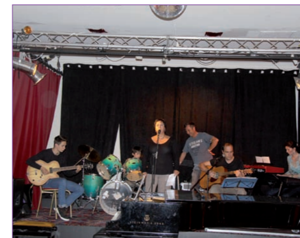
Audition de fin de saison.