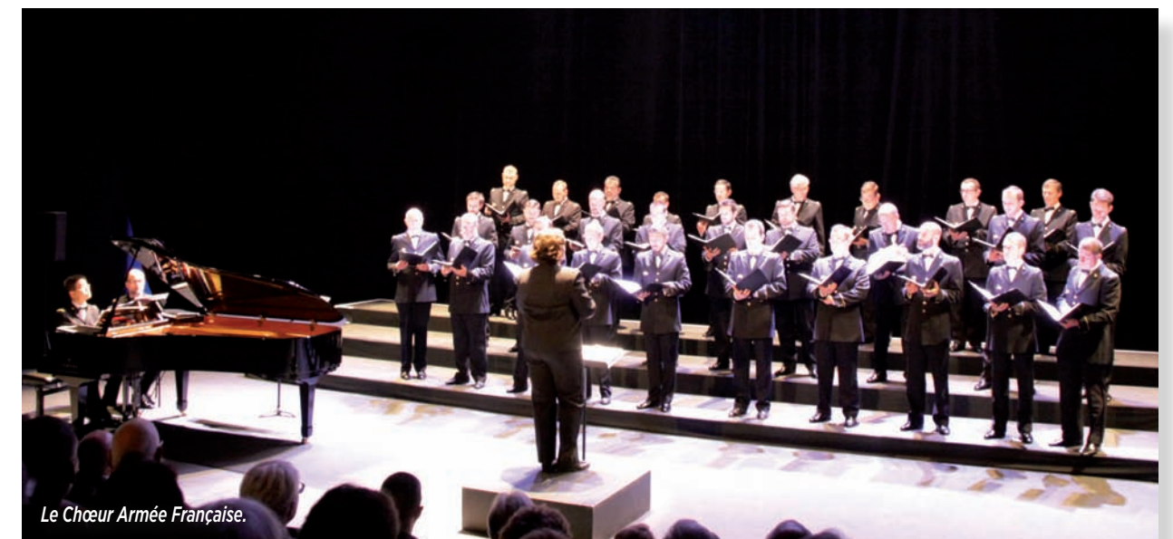
Le Chœur Armée Française.