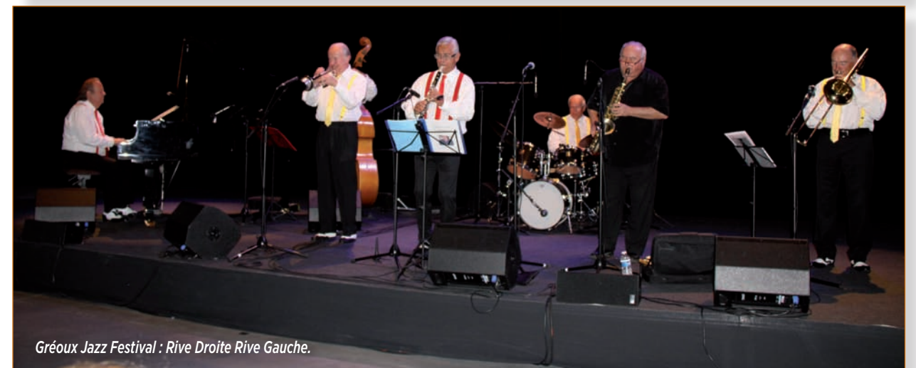
Gréoux Jazz Festival : Rive Droite Rive Gauche.