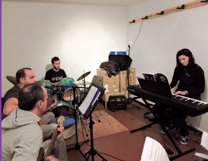
Les Profs de l'atelier musical donnent le ton.

Début janvier 2016, reprise des répétitions après le break des fêtes de fin d'année. Puis, la traditionnelle St Sébastien, Allemagne-en-Provence le 25 avril (St Marc) et début mai, au Casino pour un concert humanitaire. ■