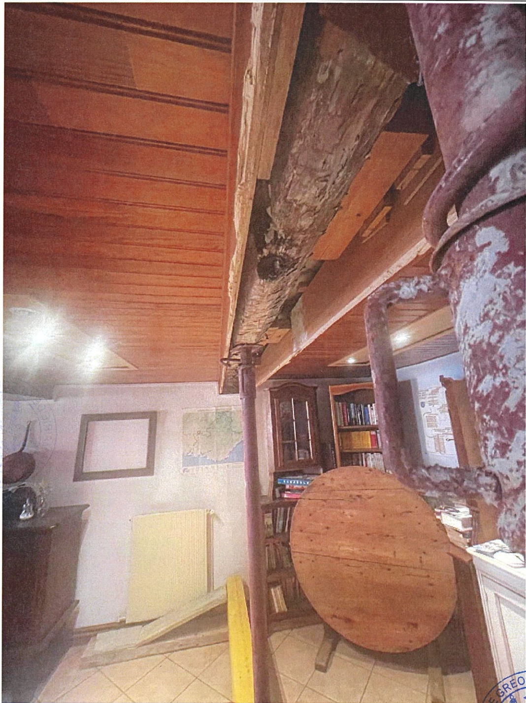
Vue de l'étalement au niveau de la poutre.