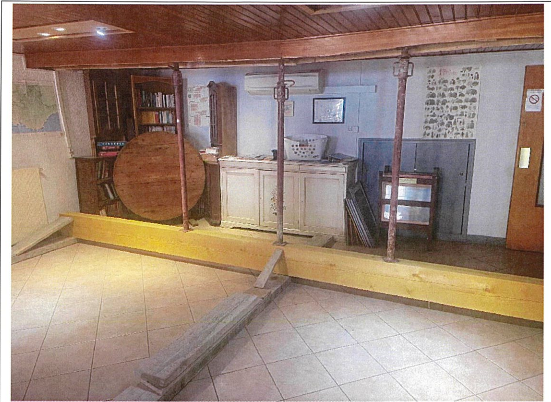
Vue de l'ensemble de l'étalement.